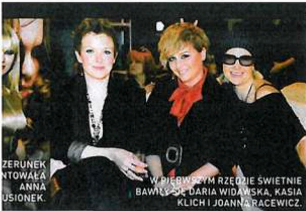
ZERUNEK NTOWAŁA ANNA USIONEK.