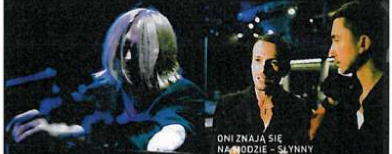
LESZEK MOZDZER DAŁ PORYWAJĄCY KONCERT.