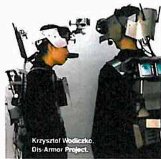
Krzysztof Wodiczko, Dis-Armor Project.

Making Worlds, biennale w Wenecji, oprócz Gdardni