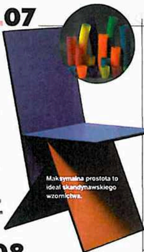
Maksymalna prostota to ideał skandynawskiego wzornictwa.

Democratic Design, Pinakoteka Nowoczesna, Monachium