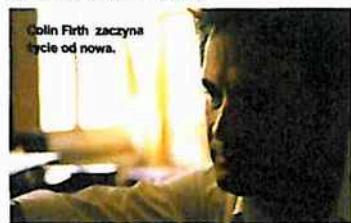
Colin Firth zaczyna życie od nowa.

Genua, Włoskie lato, reż. Michael Winterbottom