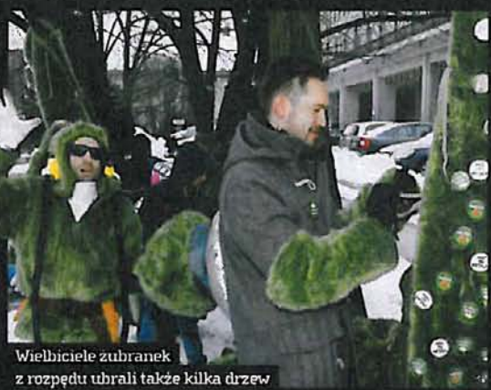
Wielbiciele zubranych z rozpędu ubrali także kilka drzew

Atutem tegorocznego zubranka jest ciekawa forma. Futerko w zielonym kolorze jest miłe w dotyku, chroni butelkę przed utratą zimna, a smakoszzy zubrowej trawy przed odmrozeniami dłoni. Ci, którzy przyłączyli się do akcji lub zostali wciągnięci do zabawy przez autorów otulaczy, dostali futro oraz limitowaną kolekcję najmłodniejszych tej zimy specjalnych znaczków z hasłami nawiązującymi do akcji: „I love trawa”, oraz „Jestem z puszczy”.