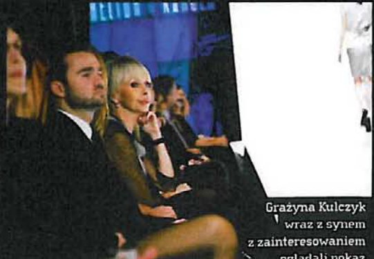
Grażyna Kulczyk wraz z synem z zainteresowaniem oglądali pokaz