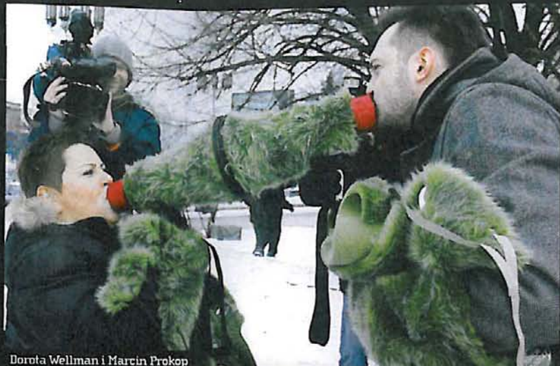
Dorota Wellman i Marcin Prokop