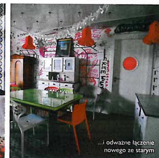
...i odważne łączenie nowego ze starym