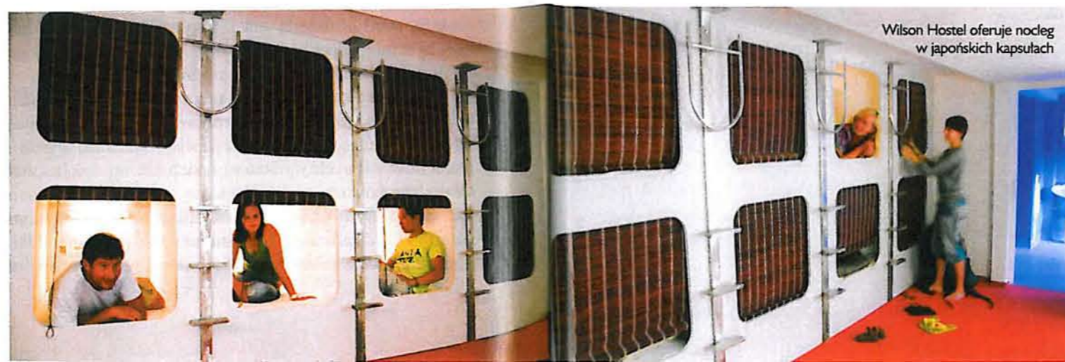
Wilson Hostel oferuje nocleg w japońskich kapsułach

Jeśli mowa o luksusie, nie można zapomnieć o najbardziej ekskluzywnym i niezwykłym arthotelu w Polsce. Blow Up Hall 5050, mieszczący się w poznańskim Starym Browarze, został uznany przez brytyjski dziennik „The Guardian” za najbardziej futurystyczny hotel na świecie. Wymyślony przez Grażynę Kulczyk obiekt jest interaktywnym dziełem sztuki, zaaranżowanym wokół multimedialnej instalacji artysty Rafaela Lozano-Hemmera. To hotel nie tylko ekskluzywny, ale bardzo intrygujący. Nie ma recepcji, a indywidualnie urządzone pokoje nie mają numerów. Zamiast klucza goście otrzymują iPhone, który pomaga znaleźć odpowiednie drzwi i jest ich wirtualnym przewodnikiem – dostarcza informacji o hotelu, znajdujących się w nim dziełach sztuki, m.in. zdjęć Vanessy Beecroft, Caio Reisewitza czy Patricka Tourneboeuf, a także o artystycznych atrakcjach Poznania. Klienci, którzy rezerwują pokoje przez internet, dowiadują się, że to nie oni zdecydują o wyborze pokoju – to pokój wybierze ich. Muszą wybrać trzy z enigmatycznych obrazków pojawiających się na ekranie. Na tej podstawie system proponuje im dwa pokoje „chętne”, by przyjąć gościa. Cena, niestety, słona. Za nocleg w pokoju dwuosobowym bez śniadania trzeba zapłacić od 1000 do 1460 zł. ■