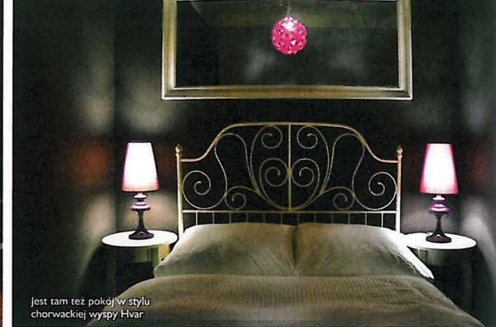
Jest tam też pokój w stylu chorwackiej wyspy Hvar