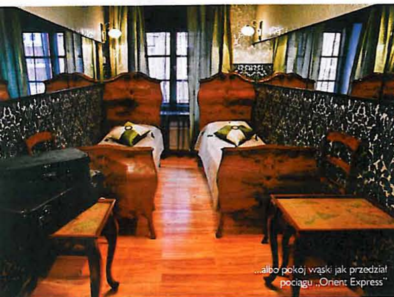
...albo pokój wąski jak przedział pociągu „Orient Express”

Oki Doki. Otwarcie Castle Inn – bardziej luksusowej wersji Oki – dwa lata temu było naszym kolejnym krokiem. Chcieliśmy zaoferować coś równie ciekawego trochę innej grupie turystów.