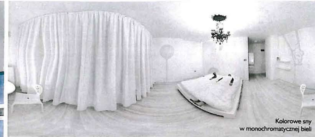
Kolorowe sny w monochromatycznej bieli