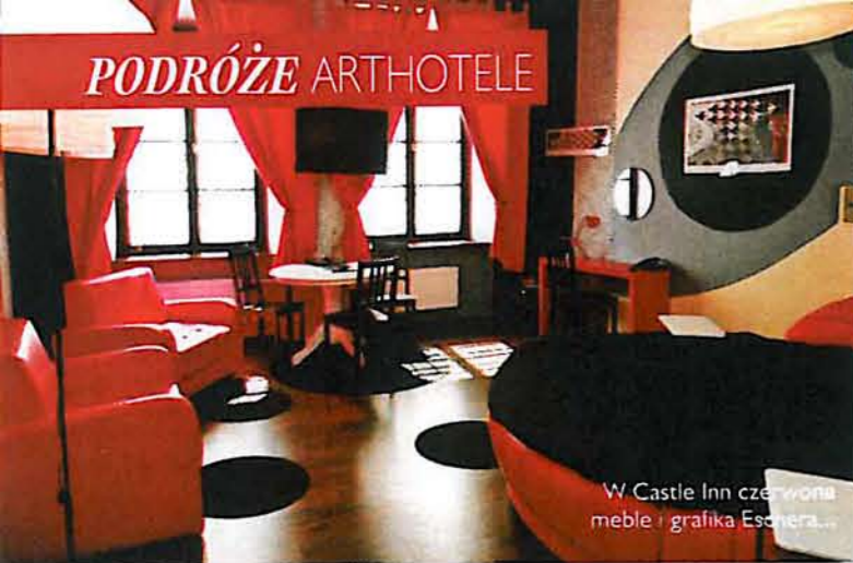
W Castle Inn czerwone meble i grafika Eschera...