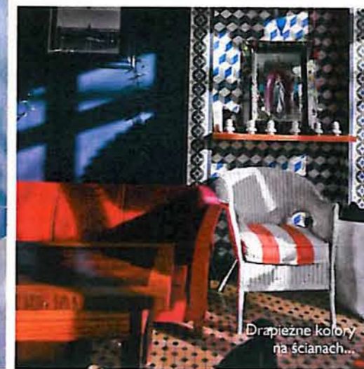
Drapieżne kolory na ścianach...