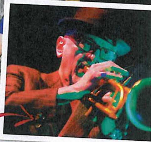
Gwiazdą finałowej gali Art & Fashion Festival w Poznaniu był wybitny jazzman TOMASZ STAŃKO .