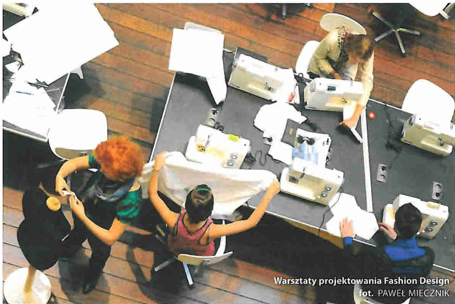
Warsztaty projektowania Fashion Design