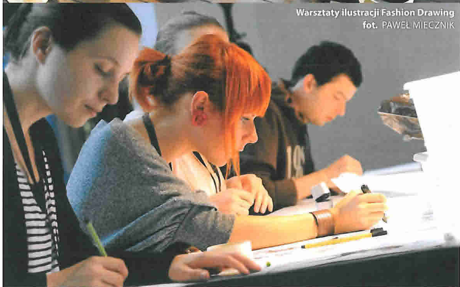
Warsztaty ilustracji Fashion Drawing