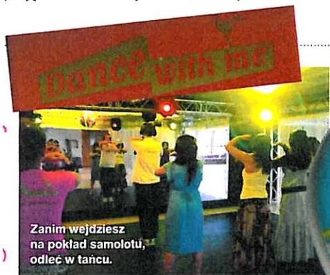
Zanim wejdziesz na pokład samolotu, odleć w taniec.

wartości mają dla Ciebie największe znaczenie? To pytanie zadał Polkom om CBOS. Szczęście rodzinne zajęło bezkonkurencyjnie pierwsze miejsce – wybrało je aż 83 proc. kobiet, a sława wydały się kuszące tylko 10 procentom z nich. Okazało się, że rodzinę cenią bardziej kobiety dobrze zarabiające i pracujące zawodowo niż gospodynie domowe. Kariera jest ważna tylko dla 18 kobiet na 100. A mężczyźni? Większość z nich też ceni życie rodzinne, choć nie są w tej kwestii aż tak jednomyślni jak kobiety. Ika zmiana, jeszcze osiem lat temu aż 77 procent Polaków uważało, że praca jest dla nich ogromną wartością. Dziś twierdzą nawet, że praca jest dla nich o wiele większe znaczenie niż pokolenie ich rodziców.